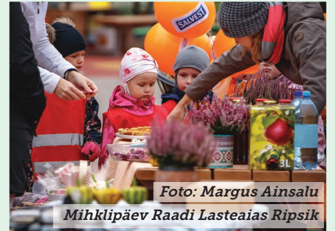
Mihklipäev Raadi Lasteaias Ripsik

Oli meeleolukas laadaõhtu, kus tunni mõnusat kogukonnatunnet ja rõõmu koosolemise ja koostegemisest.