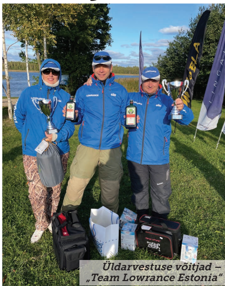
Üldarvestuse võitjad – „Team Lowrance Estonia“