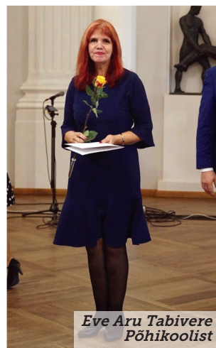
Eve Aru Tabivere Põhikoolist