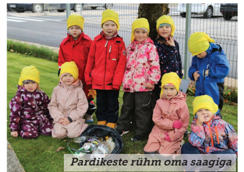
Pardikeste rühm oma saagiga

Hommikul enne koristamise algust rääkisime lastele ka, mis põhjusel ikkagi prügi korjama minnakse ning kus on prahi õige koht. Prügi- ja keskkonnateemad on lasteaia õppekavas