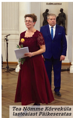
Tea Nõmme Kõrveküla lasteaiast Päikeseratas